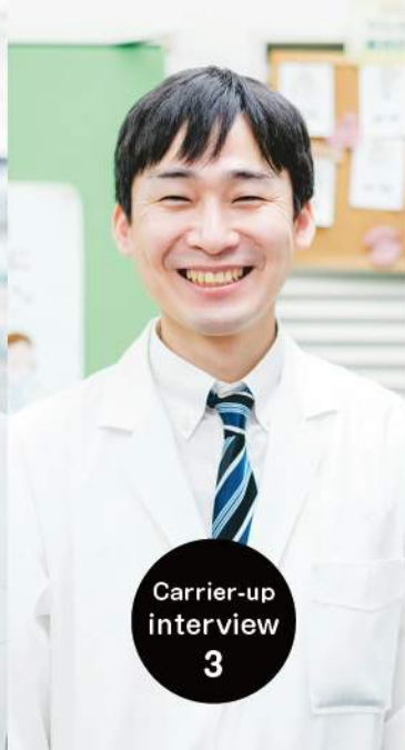
Carrier-up interview 3