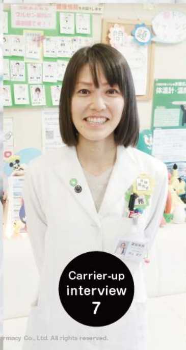
Carrier-up interview 7