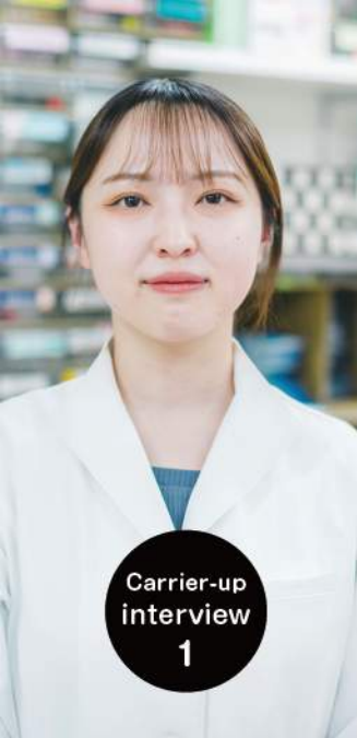
Carrier-up interview 1