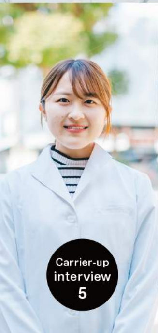
Carrier-up interview 5