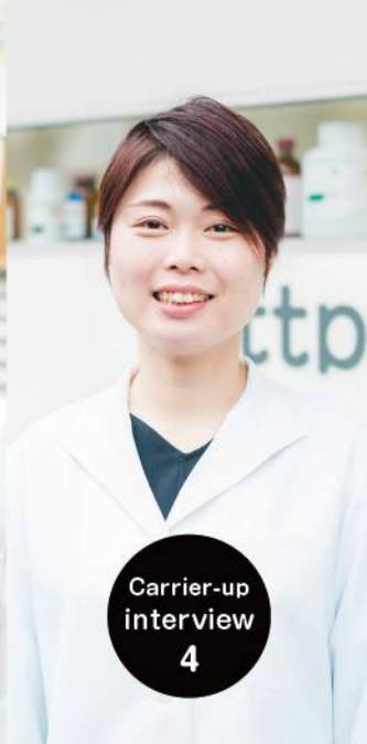
Carrier-up interview 4