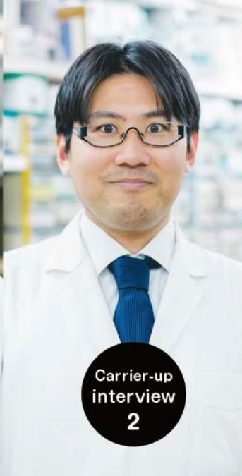
Carrier-up interview 2