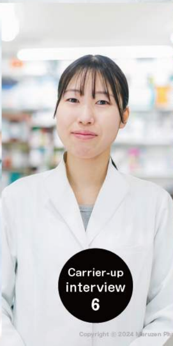
Carrier-up interview 6