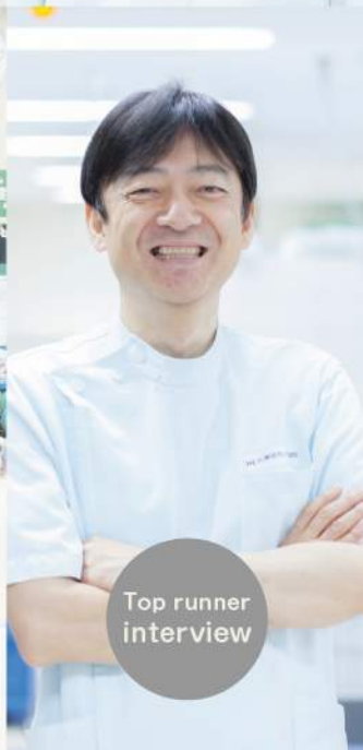
Top runner interview